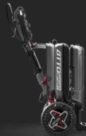
Vo forme vozíka